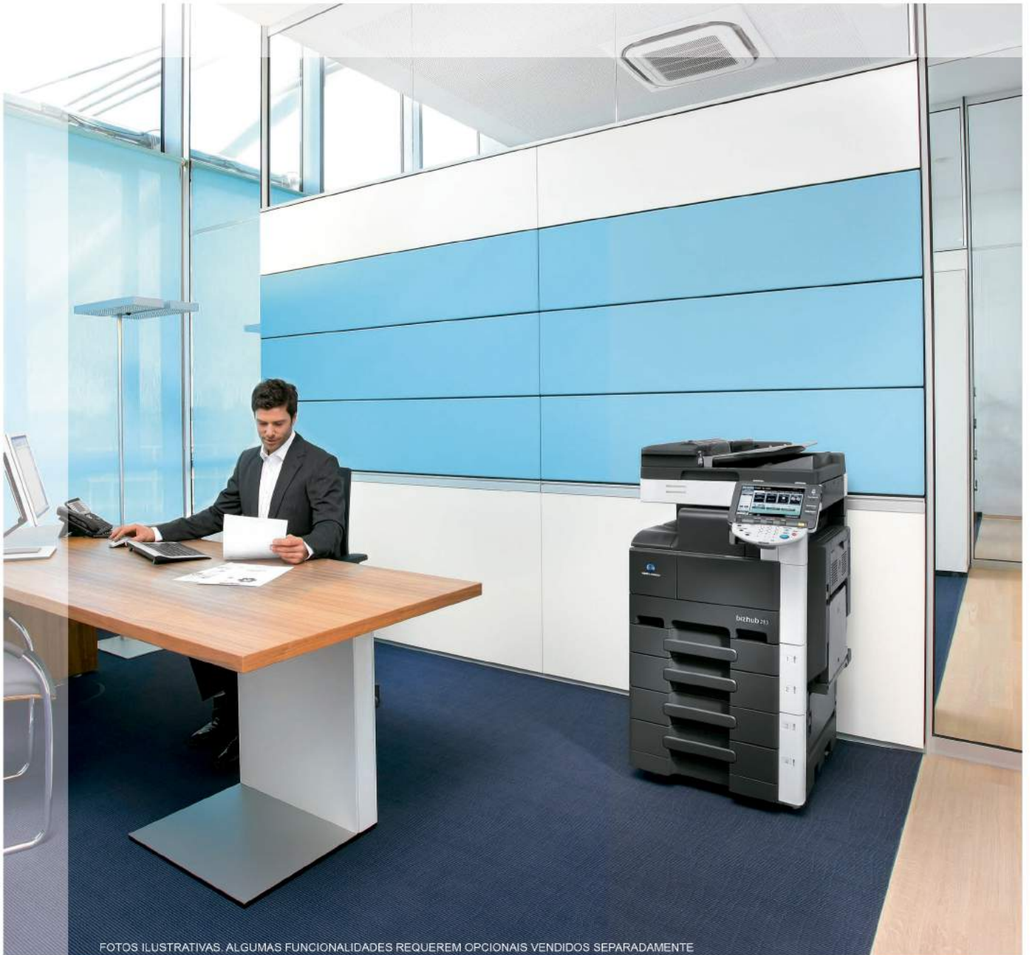
FOTOS ILUSTRATIVAS. ALGUMAS FUNCIONALIDADES REQUEREM OPCIONAIS VENDIDOS SEPARADAMENTE

Impressora | Copiadora | Scanner | Fax (6)