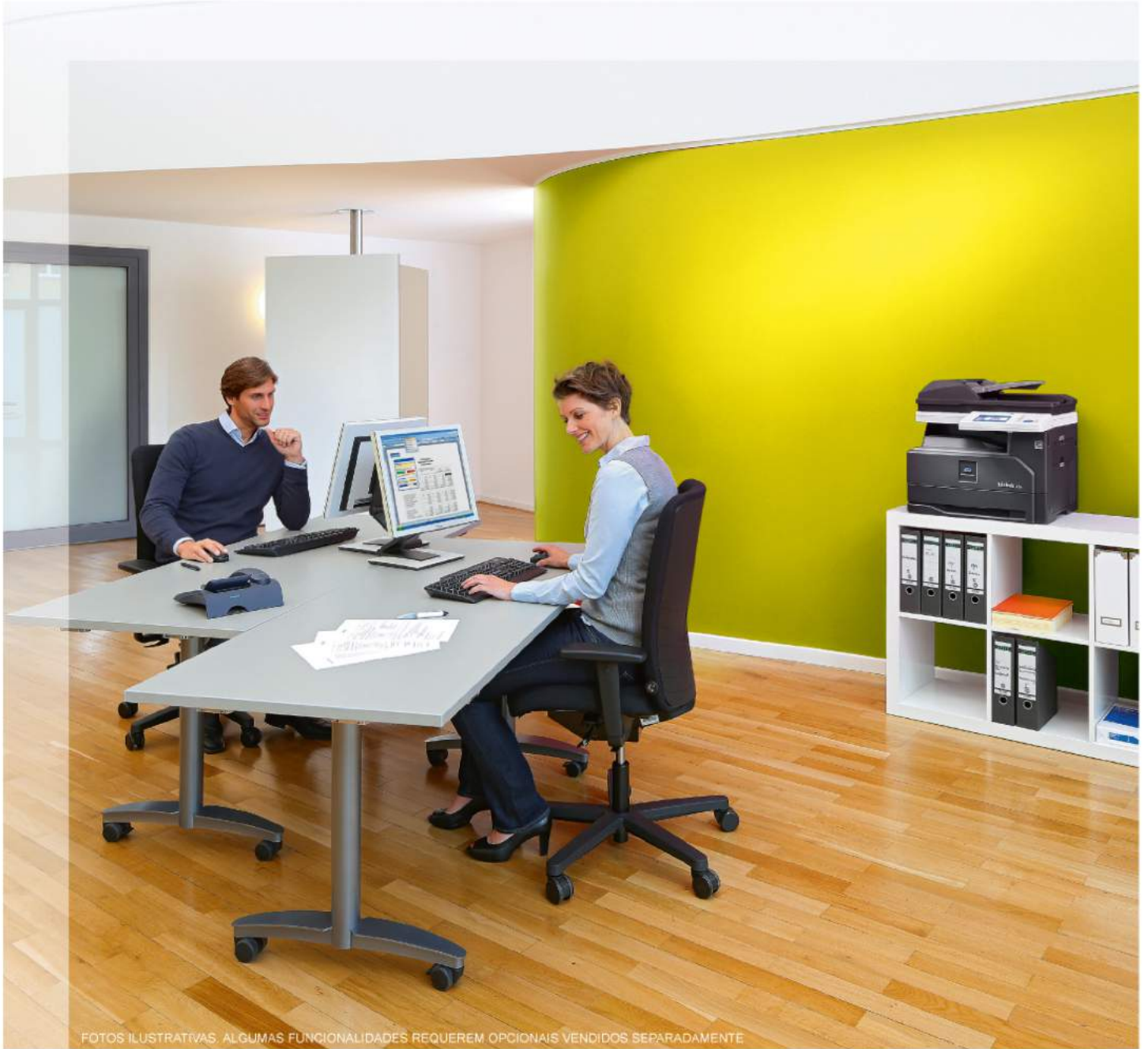
FOTOS ILUSTRATIVAS. ALGUMAS FUNCIONALIDADES REQUEREM OPCIONAIS VENDIDOS SEPARADAMENTE.